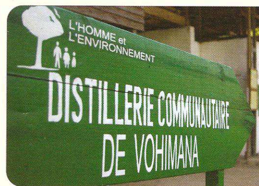
Distillerie du site de Vohimana.

Ce partenariat a permis de concilier les contraintes et spécificités de programmes et métiers différents : aspects environnementaux, aspects techniques et technologiques des réalisations, aspects socio-économiques. Ceci n'aurait pu se